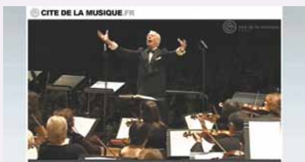
Capture écran d'une vidéo à la demande

Pour faciliter l'accès à toute cette offre audiovisuelle, la Cité de la musique et la Salle Pleyel proposeront très prochainement un espace vidéo identifié , mettant en avant les concerts en direct à venir, les concerts en VOD et une partie de ses archives, visibles en intégralité.