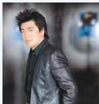
© Lang Lang

Chanteuse engagée, poétesse intransigeante, voix de la colère ou de l'intimité : Patti Smith est tout cela et bien plus. Dans le cadre du Domaine privé que la Cité de la musique lui consacre du 17 au 22 janvier 2010, l'artiste américaine viendra deux fois à la Salle Pleyel. D'abord, elle rendra hommage à Allen Ginsberg (1926-1997), emblème de la beat generation , accompagnée par Philip Glass au piano. Patti Smith lira des poèmes de Ginsberg, ainsi que ses propres œuvres que le poète a manifestement inspirées. Le lendemain, Patti Smith jouera Horses , album culte (1975) qui eut une influence décisive pour la naissance du mouvement punk-rock. Depuis, le disque n'a pas pris une ride et, lorsque la chanteuse le fait revivre sur scène plus de trente-cinq ans après, ses titres brillent de tous leurs feux, irradiant une énergie intacte, comme au premier jour.